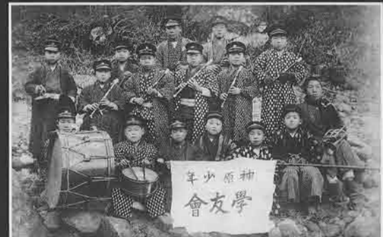
▲神原少年学友会の音楽隊 (神流町・大正13年) 金管楽器やシンバルも見え、かなり本格的な編成である。神原少年学友会は明治36年に発足し、討論会や勤労作業などさまざまな活動を行なった。