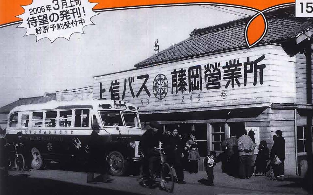
▲バスを待つ上信バス藤岡営業所前 (藤岡市・昭和30年頃) 上信電気鉄道株式会社は明治28年の設立。小型のボンネットバスは細い峠道でも通行することができ、自家用車の少ない時代、地域の人びとの大切な交通手段となっていた。