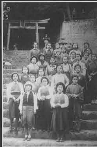
▶妙義登山に訪れた藤岡女子青年団 (妙義町・昭和17年頃) 妙義神社参道での記念撮影と思われる。妙義山は日本三大奇勝に数えられ、古くから多くの登山者が訪れた。