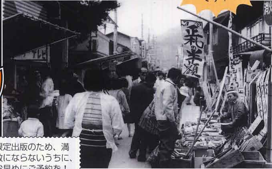
▲ひな市のにぎわい (神流町・昭和55年) 毎年3月31日に開かれる万場三大祭りのひとつ。通りには露店が立ち並び、さまざまなものを販売していた。以前は道路沿いで行なわれていたが、近年は学校の校庭などで開かれている。