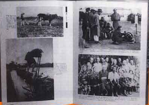
B4判の大型本。大きく迫力ある写真とわかりやすい解説が特徴です。