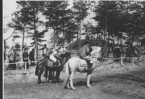
▲天久沢観音の草競馬 (吉井町・昭和55年) 馬頭観音の祭りにあわせて行なわれた草競馬でのひとコマ。人びとが楽しみにしていた行事であったが、この年が最後の開催となった。