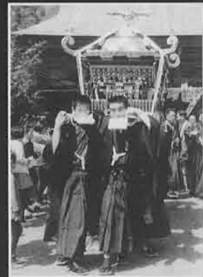
◀乙父貫前神社の例大祭 (上野村・昭和45年頃) 村内を流れる神流川につくられた「御台所」でご神体を清める「お川下げ」に向かうため、紋付袴姿の若者によって神社から神輿が運び出されるところである。